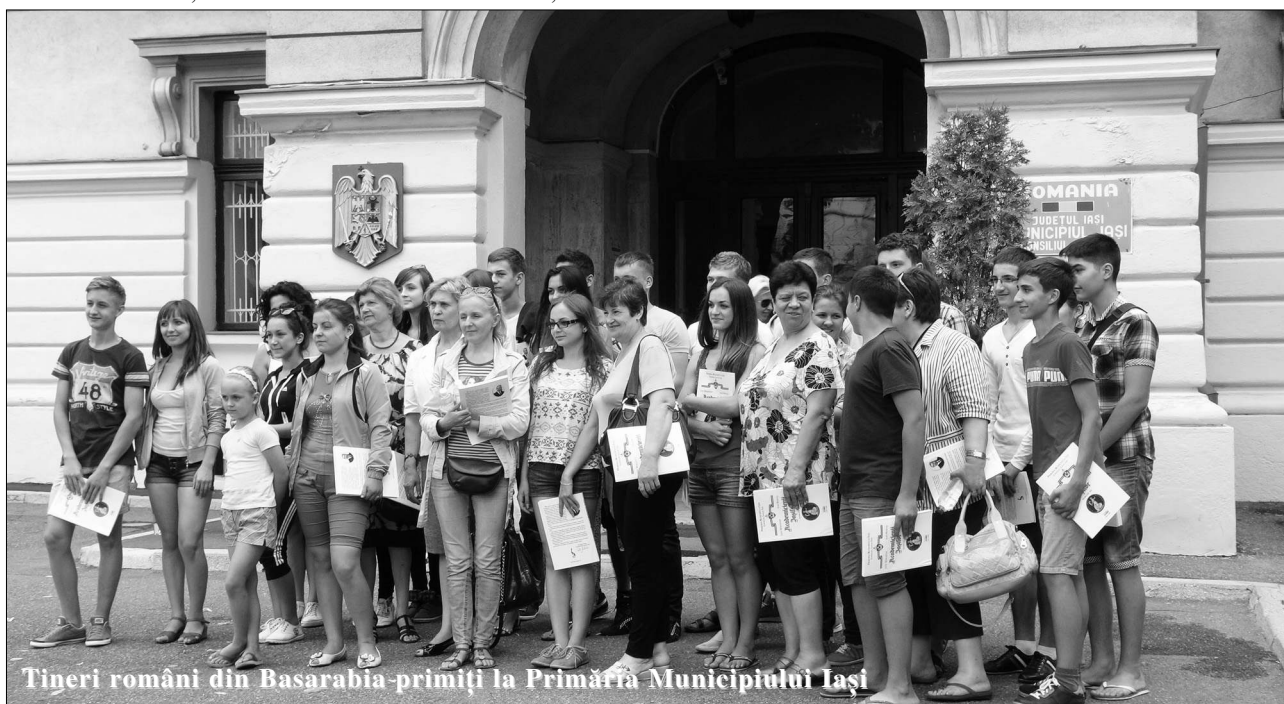
Tineri români din Basarabia-primiți la Primăria Municipiului Iași

„Carte frumoasă, cinstei cui te-a scris”, răsună dictonul arghezean în auz, să strălucești în mîinile cititorilor, dăinuind în veci!