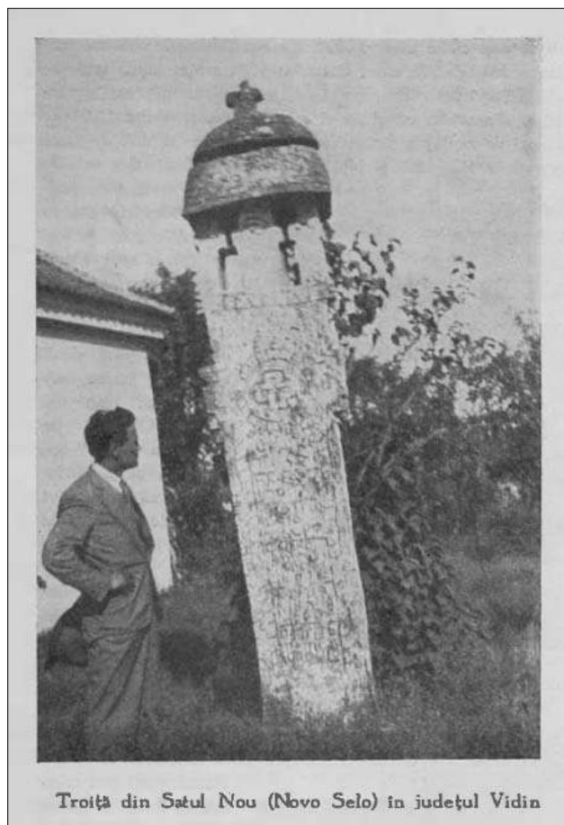
Trotița din Satul Nou (Novo Selo) în județul Vidin

[„Boabe de grîu”, An. I, nr. 7, sept. 1930, p. 443-446]